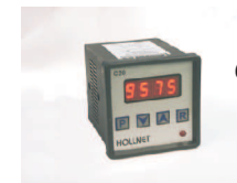
Contador digital modelo C20