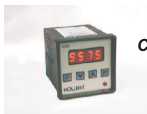
Contador digital modelo C20