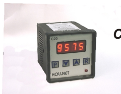
Contador digital modelo C20