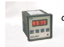
Contador digital modelo C20