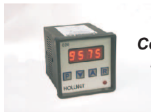
Contador digital modelo C20