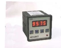
Contador digital modelo C20