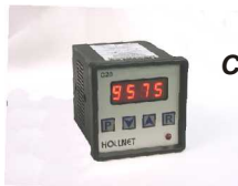
Contador digital modelo C20