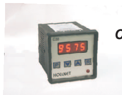
Contador digital modelo C20