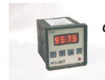
Contador digital modelo C20