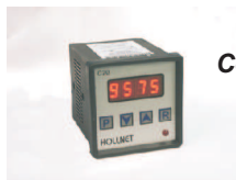
Contador digital modelo C20