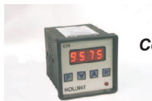
Contador digital modelo C20